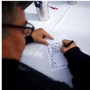
Desde el presente, un mensaje para los 70