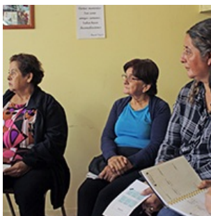
Hacer camino en comunidad