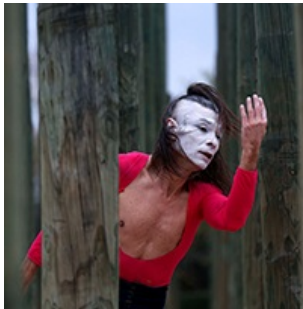
Un nuevo aniversario, nuevos desafíos