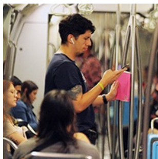
El respeto por lo distinto